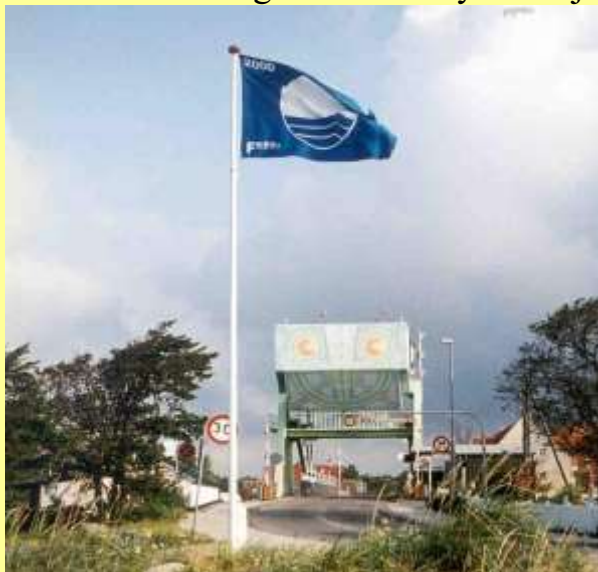
Græshoppen med Dansk Friluftbads Blå flag

Så endnu engang, velkommen til ”Stølsgården ” Bestyrelsen juni 2007