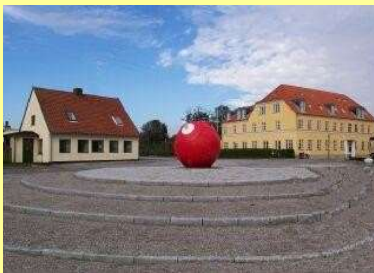
Kugletorvet med den gamle Kuglekoger.