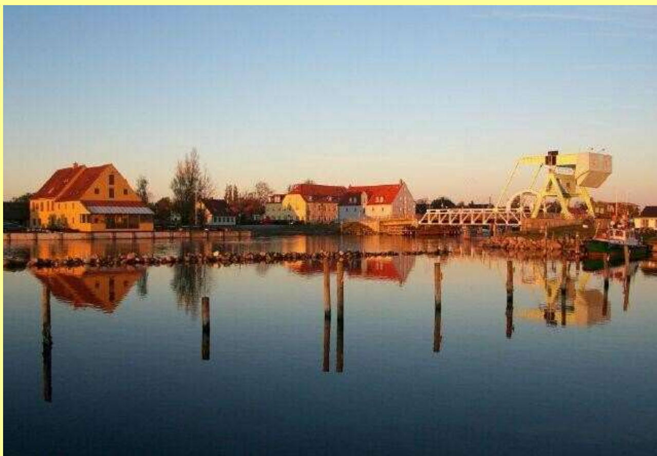
Indsejlingen ved Vippebroen ” Græshoppen ”